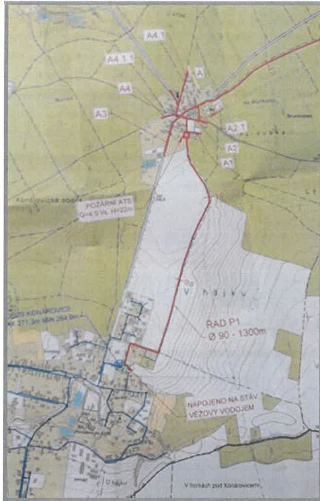
Návrh vodovodu na Jelen